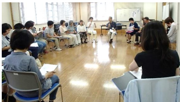
傾聴研修 H29.9.22実施 参加者21名

普段の活動に活かせる「傾聴研修」や、緊急時に備えて「普通救命講習会」の実習を行いました。 今後も活動会員の資質向上に取り組んでいきます。