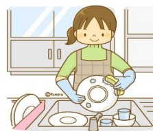
食事作り・かたづけ