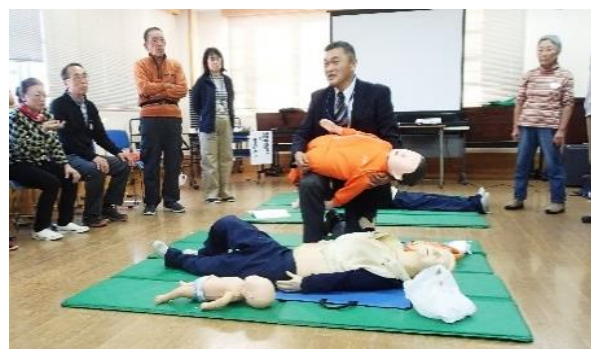
普通救命講習会 H29.11.29実施 参加者28名