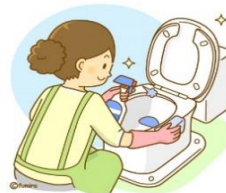
お風呂・トイレ掃除