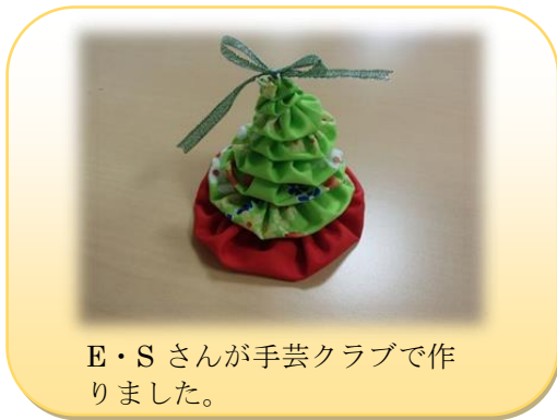
E・Sさんが手芸クラブで作りました。