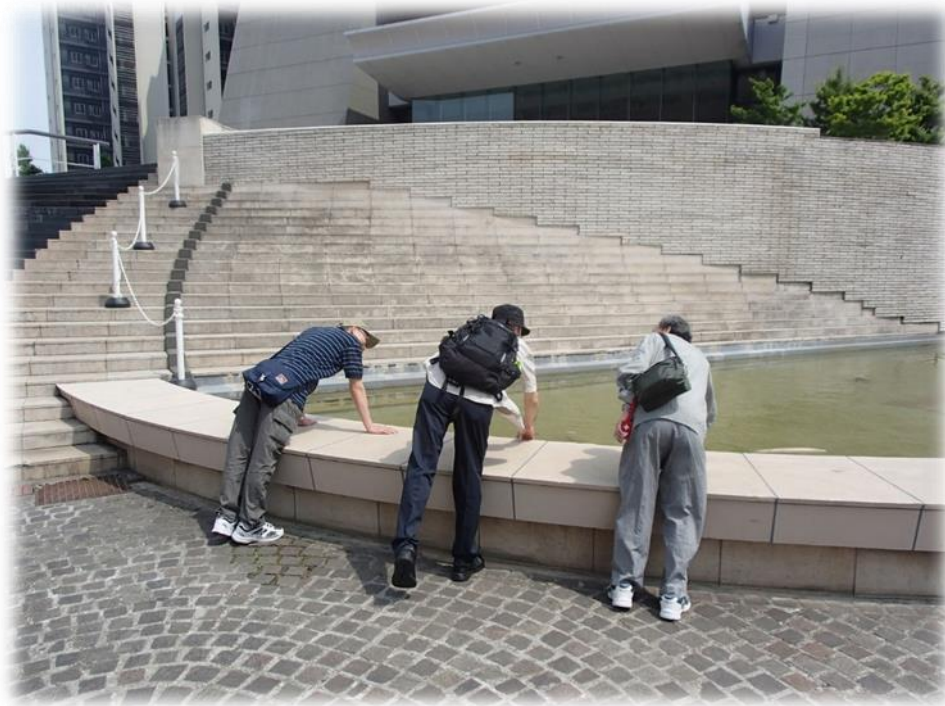
外出プログラム in 多摩センター