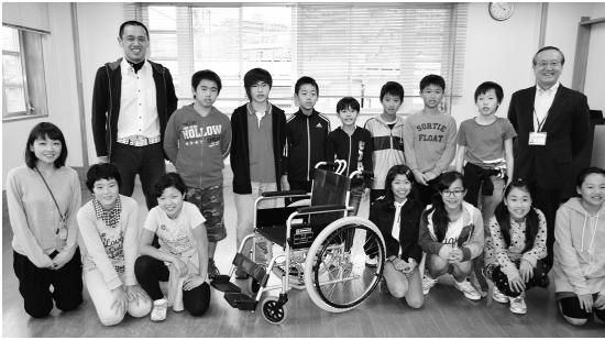
環境委員の皆さん

稲城第三小学校の皆さんから、車いすをご寄贈いただきました。これは、平成20年度から取り組んでいる「アルミ缶とプルトップ回収」により集まった資源から得られたお金で車いすを購入し、ご寄贈いただいたものです。