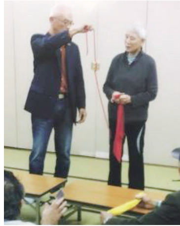
和気あいあいとした練習

▽定例会 城山文化センター 第2・4日曜日午後0時45分〜3時 ▽会費 1500円/月