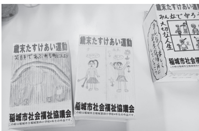
心あたたまる募金箱

児童の皆さんは今年の福祉体験学習で手話、点字、白杖、車いすの体験を行いました。募金箱の絵からは子どもたちがその時に感じたあたたかい気持ちや伝わってきます。ご協力をいただいた多くの皆さまに御礼を申し上げます。引き続き募金活動へのご協力をお願いいたします。