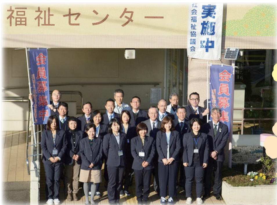
こんにちは！稲城市社会福祉協議会です