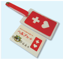
稲城市のヘルプカード

◇知っているですか? 「ヘルプカード」ヘルプカードは東京都が推奨している赤いカードで、お願いしたいことが簡潔に書かれています。これを見せれば、話せない人や知的障がいのある人は、周りの人に助けてもらえます。安心安全連絡会では行政や社会福祉協議会と協力しながら普及啓発活動を行っています。市内小中学校を訪れて社会福祉協議会、福祉教育の中でヘルプカードの説明をしています。◇障がい者交流ひろば 市内には当