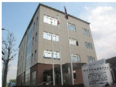
地域振興プラザ外観