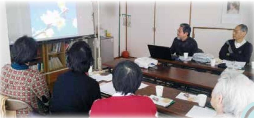
長峰の植物を学びます (五番街倶楽部)