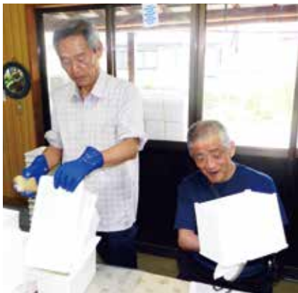
宅配用牛乳箱をきれいにしています

動することにより、いろいろな方々と知り合えたこと、また今までやったことのないことを体験できたことでした。特に農業のお手伝いはその大変さと収穫の喜びを知り、勉強になりました。私にとって現在ではボランティア活動は人のためというより自分自身の健康のため、規則正しい生活を送るための手段となっています。ボランティア活動というと被災地の救援活動を思い浮かべますが、身近にも手助けを必要とされている方々は沢山おり、またその内容も様々です。皆さんも社会とつながりを持ち、自身の生活を豊かにするひとつの手段として、ボランティア活動に参加してみたいかがでしょうか。皆さんにも何かできることがあるはずですよ。