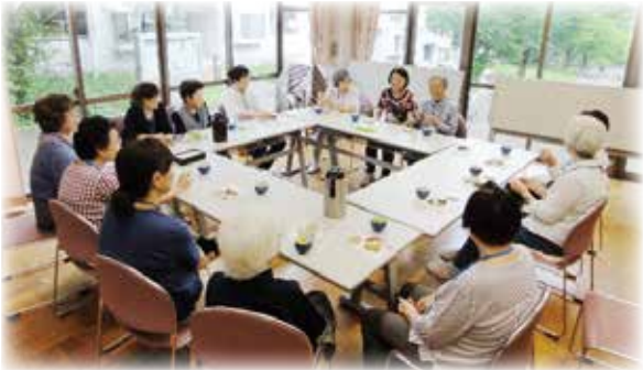
明るいお部屋で話も弾みます (だんらん向陽台)

発行：社会福祉法人 稲城市社会福祉協議会 所在地：〒206-0804 東京都稲城市百村7番地 稲城市福祉センター内 電話：042-378-3366 FAX：042-378-4999 ホームページ：http://inagishakyo.org