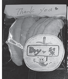
甘味の詰まった乾燥梨