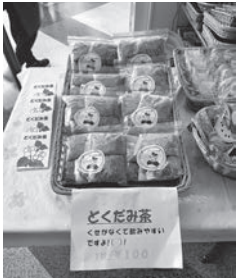
どくだみ茶は陽だまりで販売しています