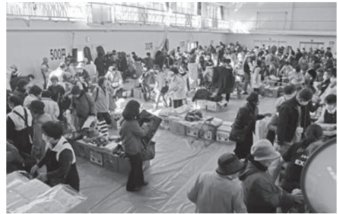
掘り出し物がたくさん！バザー会場