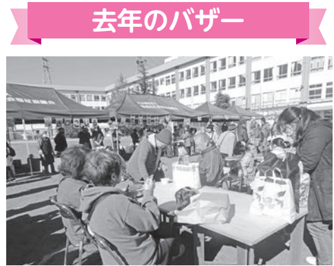
青空の下、模擬店の食べ物をもぐもぐ