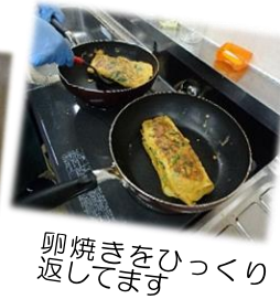
卵焼きをひっくり返してます