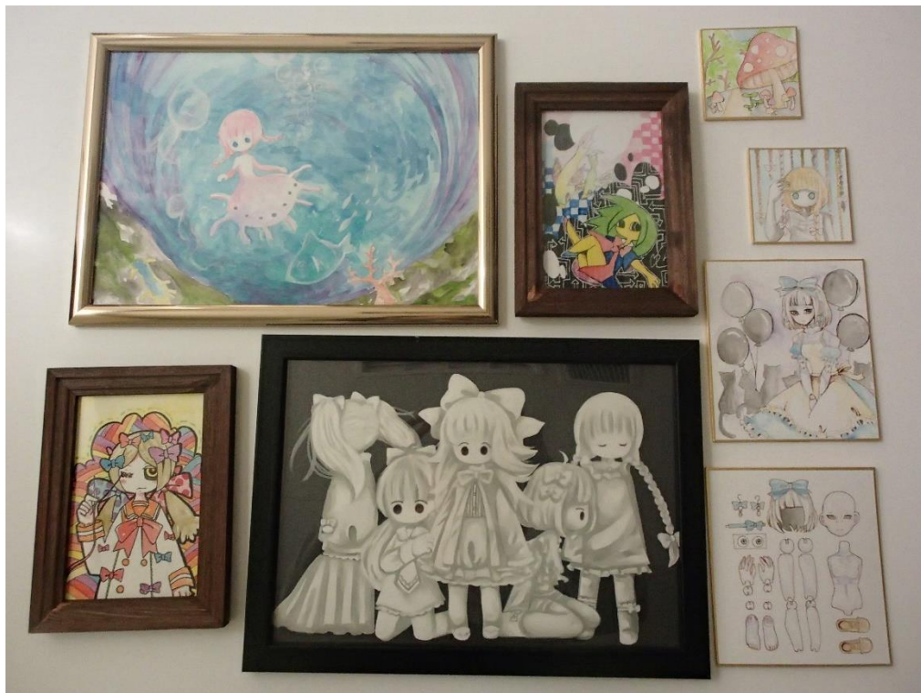
ペンネーム雪美さんの作品です