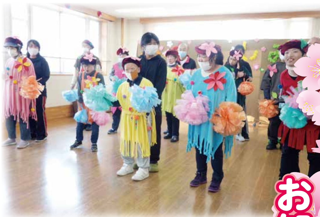
3月26日に実施した生活介護事業（通所訓練室スカイ・梨の郷）のおたのしみ会