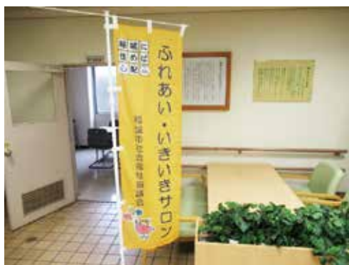
新型コロナウイルス感染症拡大防止対策を行いながら継続しているサロンもございます。この旗を見かけましたら、お気軽に中をのぞいてみてください。

サロン登録には条件があります。詳細については、地域福祉係までお問い合わせください。