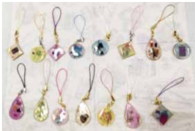
(文責:木村 貴子) 活動内で作っている作品 レジンチャーム

現在は個別勉強会、コミュニケーショントレーニング、合唱団「きらら」、手芸教室「ジュシユ」、フェルデン体操(保護者向け)を行っています。人が一番大事であると乗馬会で学習しましたので、講師は厳選しています。参加しやすく、参加しただけで立っていただくような活動を行っています。