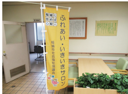
この旗を見かけたら、お気軽に中をのぞいてみてください。

サロン登録には条件があります。詳細については、ボランティアセンターにお問い合わせください。