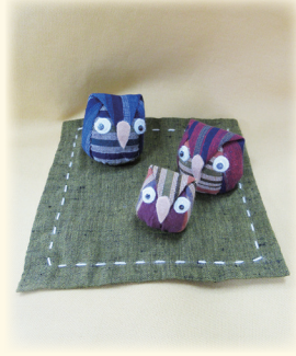
②6月「フクロウの親子」