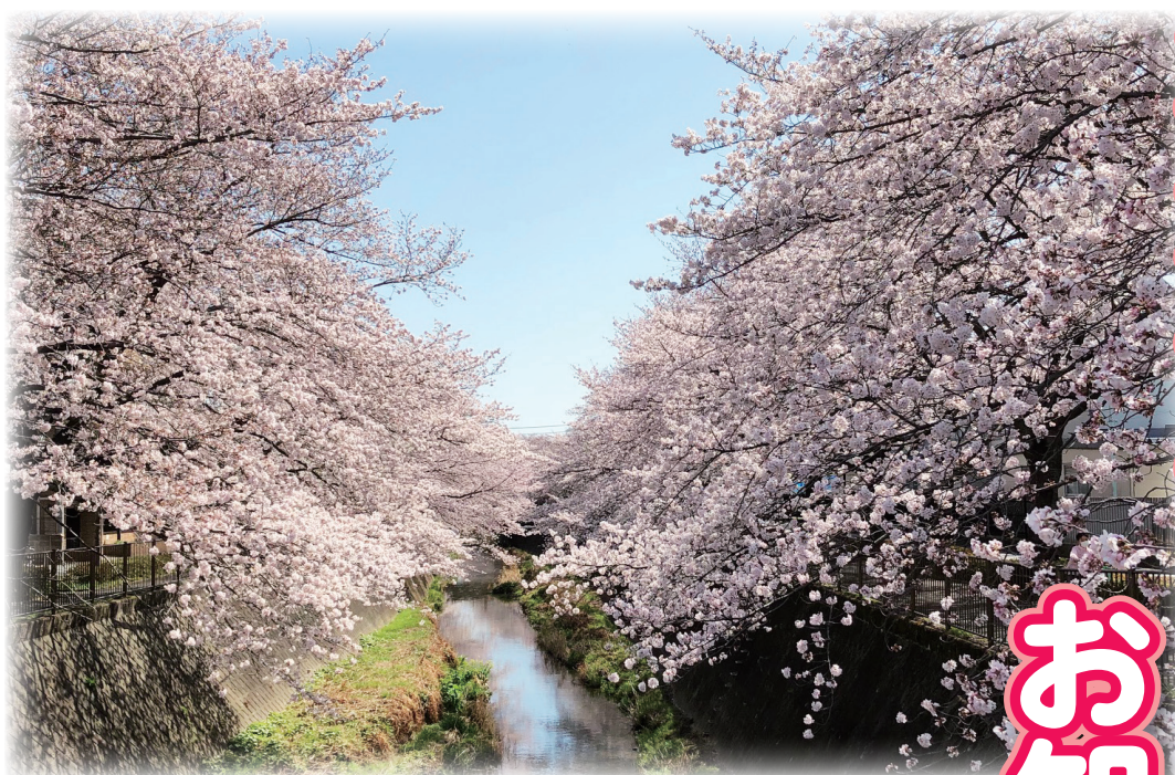
ペンネーム コアラさんからの投稿 「三沢川と桜」 満開の桜をみることで明るく晴れやかな気持ちでウキウキしていました