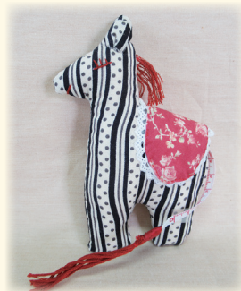
①5月「しまつまのメジャー」