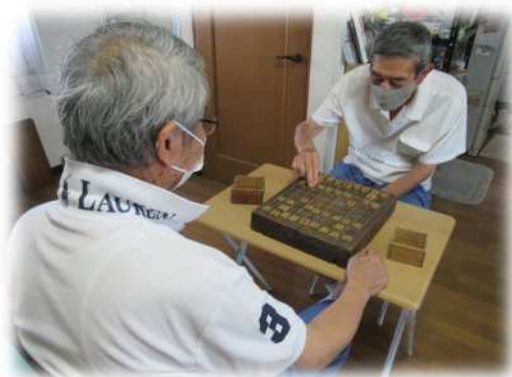
「男性も参加しています」