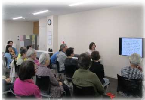
「みんなで集まると元気が出ます」