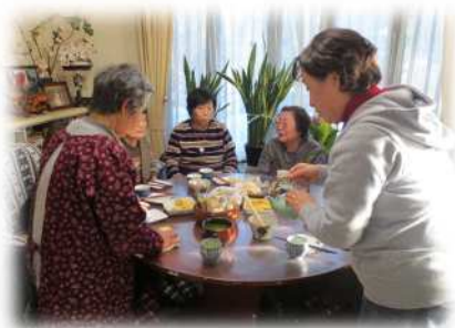
「お茶をしながらおしゃべり」