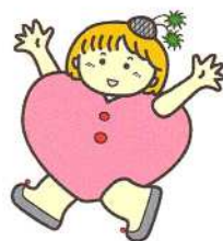
いなぎのボランティアシンボルマーク “ハートちゃん”