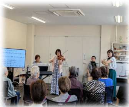
「みんなで集まると元気が出ます」