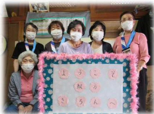
「ようこそ根方さろんへ！」

地域の中で、誰もが気軽に集える場所をつくることによって、住民同士の交流やふれあい、仲間づくりを促進していく活動です。各サロンは、人と人をつなぐふれあいの場として、地域の皆さんが運営してくださっています。