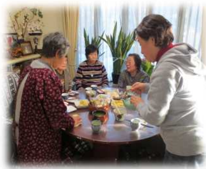
「お茶をしながらおしゃべり」