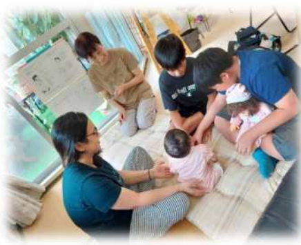
「男性や子どもも参加しています」