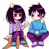
とまりぎキャラクター スズメちゃんとタカくん