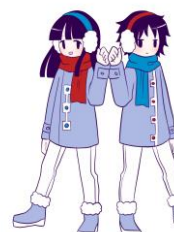
とまりぎキャラクター スズメちゃんとタカくん