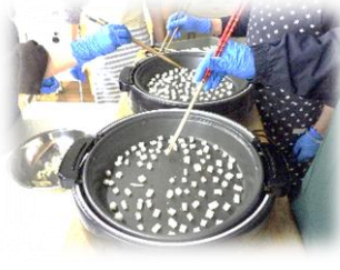
② ホットプレートで焼く