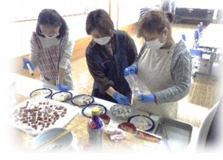
③ 5つの味にコーティング