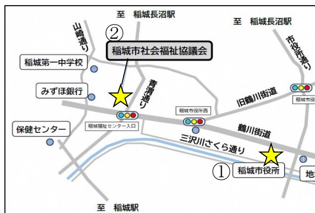
※稲城市役所・社会福祉協議会地図

稲城市社会福祉協議会 在宅支援係 電話：042-370-2480 Fax：042-379-3722 メール： soudan@inagishakyo.org 住所：〒206-0804 稲城市百村7番地 稲城市社会福祉センター内